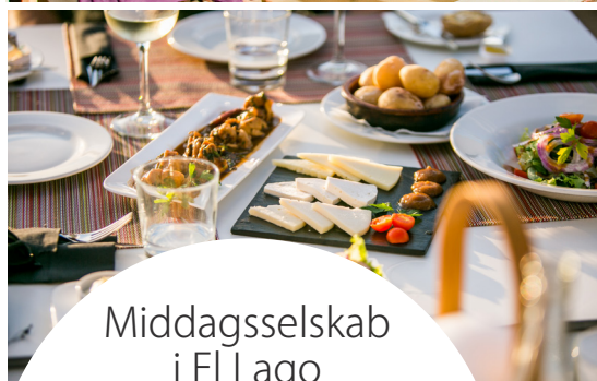
Middagsselskab i El Lago